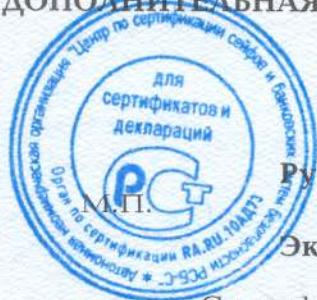
Схема сертификации - 1с